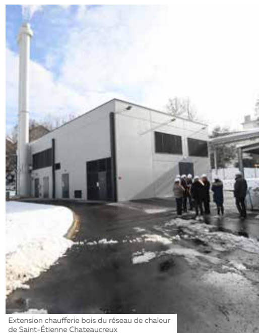
Extension chaufferie bois du réseau de chaleur de Saint-Étienne Châteaureux

tousacteursduclimat@saint-etienne-metropole.fr